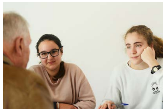
«Fálame da emigración: o valor da experiencia» é o proxecto interxeracional de Afundación

O obxectivo deste proxecto é que os socios e socias dos Espazos +60 que estiveses na emigración transmitades á mocidade os coñecementos e experiencias adquiridos durante a vosa estancia fóra de Galicia, ao tempo que vos enriquecedes coa visión da xente nova. Os rapaces e rapazas dos institutos escollidos serán tamén participantes activos desta experiencia. Ante todo, esta é unha oportunidade para o diálogo e o entendemento mutuo, para compartir vivencias e emocións arredor das historias da emigración galega da que vós sodes protagonistas.